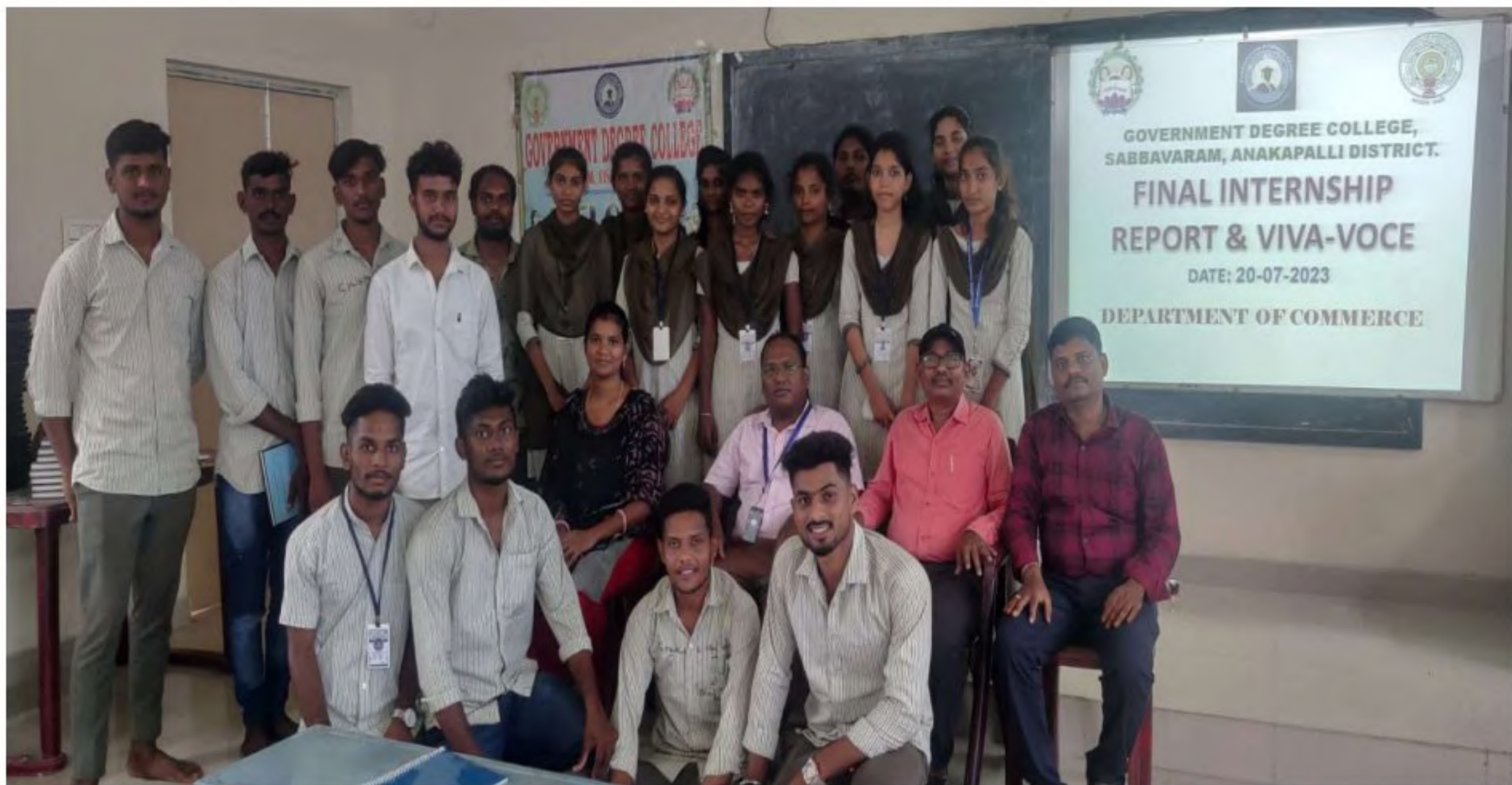
Group Photo with all Final year Outgoing students