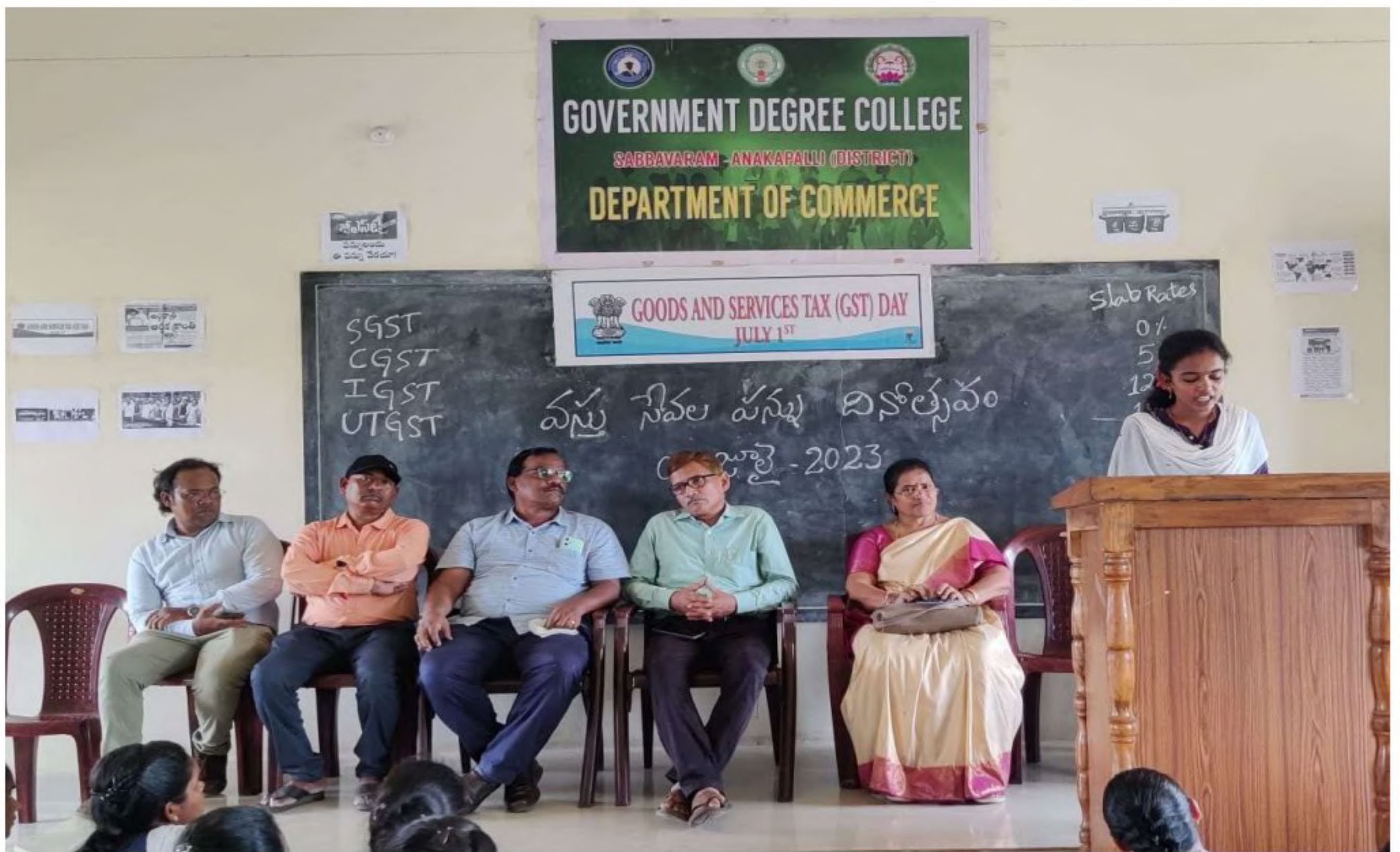
Students participation on debate