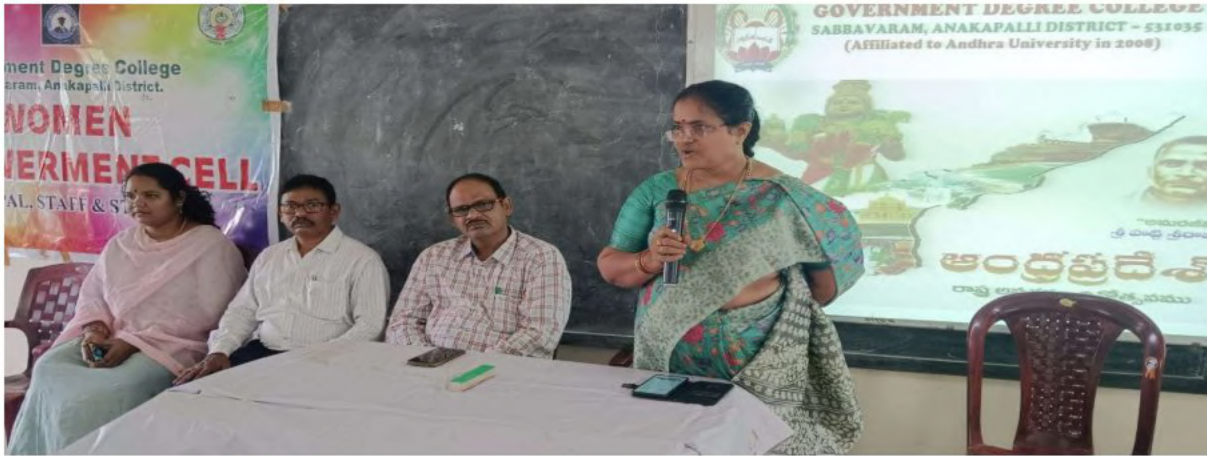
Principal madam addressing the gathering