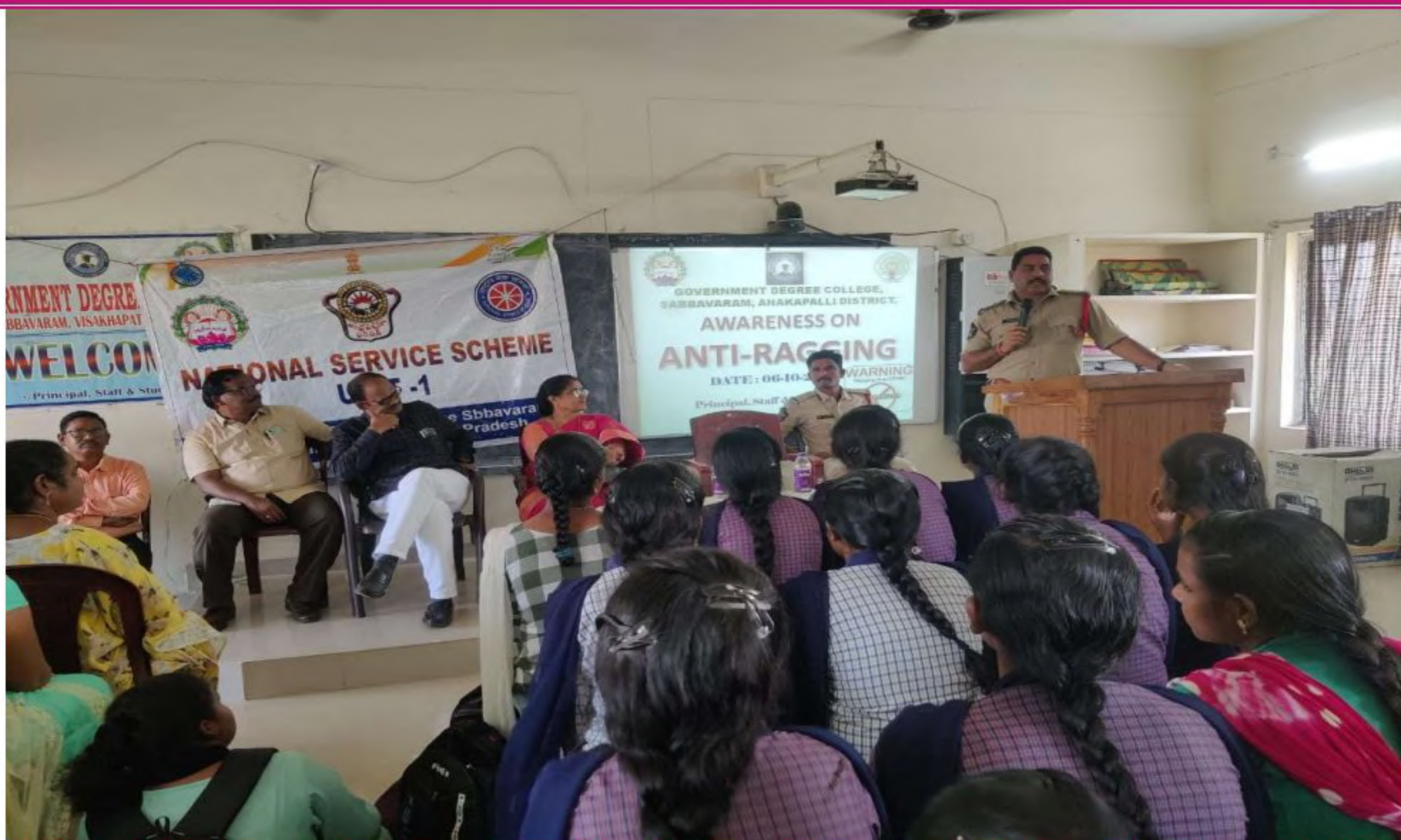
Circle Inspector of Sabbavaram Mandal creating awareness on laws pertaining to Anti Ragging