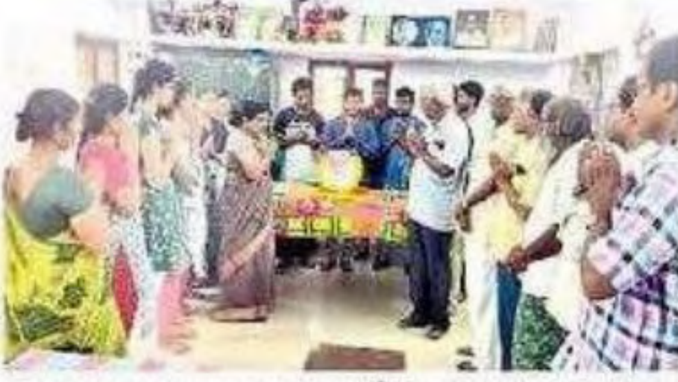
పెందుర్తి గ్రంథాలయంలో పింగళి చిత్రపటం వద్ద నివాళులర్పిస్తున్న పాఠకులు