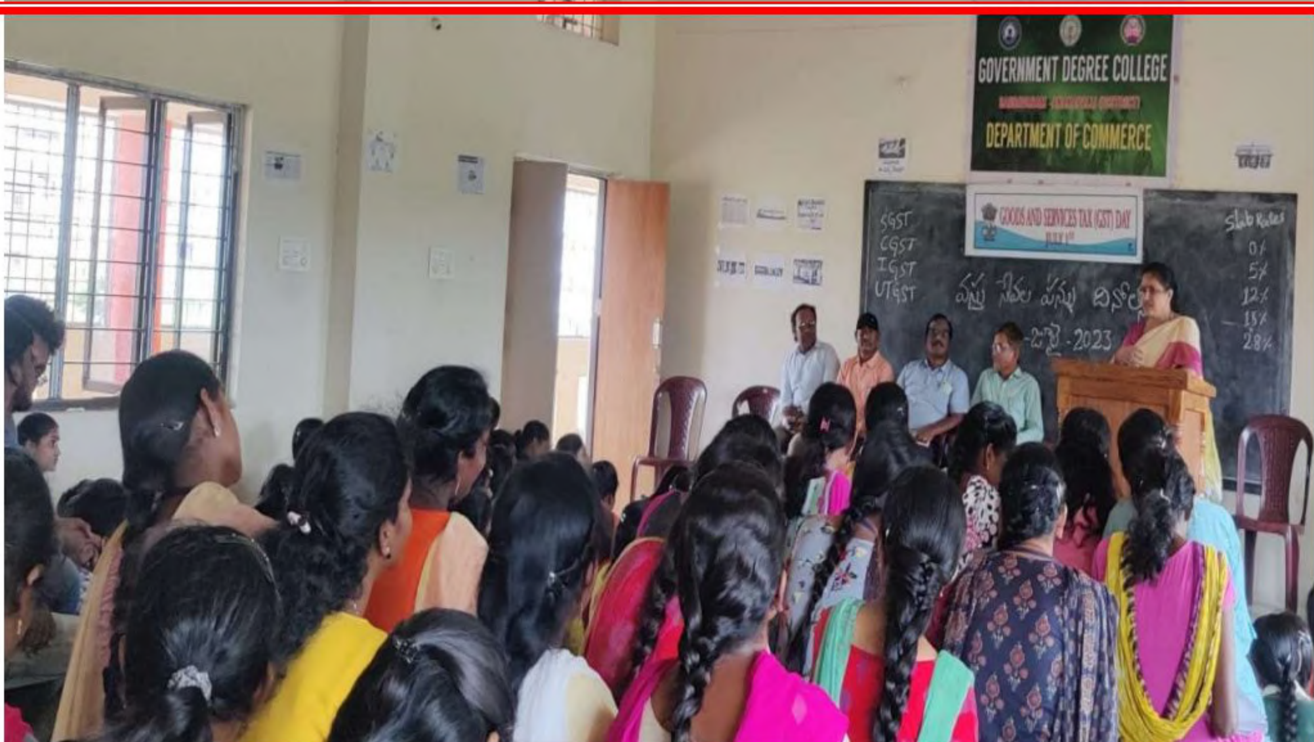
Honourable Principal madam Inaugurating the event